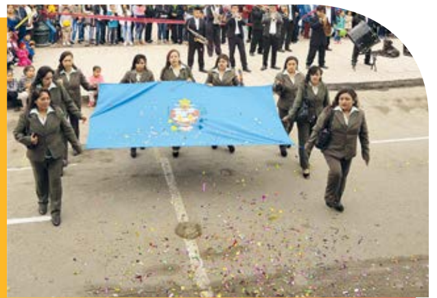
Trabajadoras de la Municipalidad llevando con orgullo la bandera del distrito y dando inicio al desfile por la celebración de la instalación del primer cabildo.