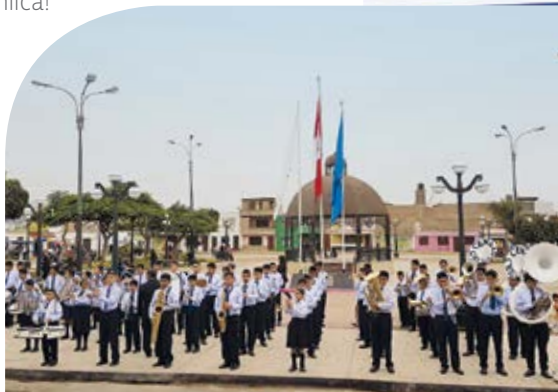
Como cada año la banda musical de la IEP Nuestra Señora de la Asunción acompañando las actividades del desfile.