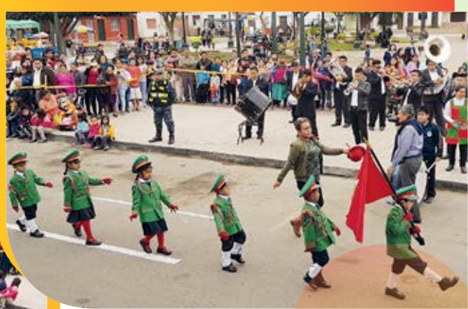
El futuro de nuestro distrito, los pequeñines que estudian en los diferentes PRONOEI e Instituciones Educativas de Educación Inicial marcharon ordenadamente y en conjunto con sus padres y maestras prepararon diferentes maquetas que representaron la cultura, historia y tradiciones de Chilca.