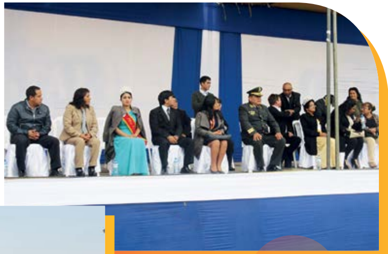
Las más importantes autoridades del distrito en el palco de honor, saludando a las diferentes delegaciones de los colegios y organizaciones de Chilca presentes en el desfile.