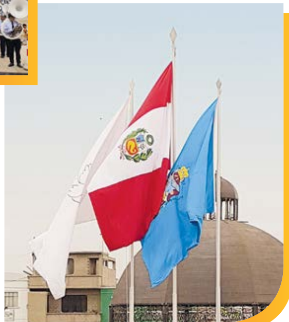
Las sagradas banderas del Perú y del distrito de Chilca, al lado de la bandera blanca que simboliza la paz entre los chilcanos.