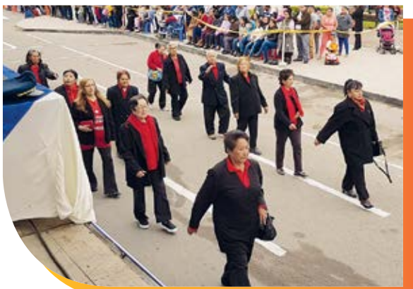
Club del Adulto Mayor Las Salinas de la Microred de Salud Chilca participando con entusiasmo y orgullo chilcano.