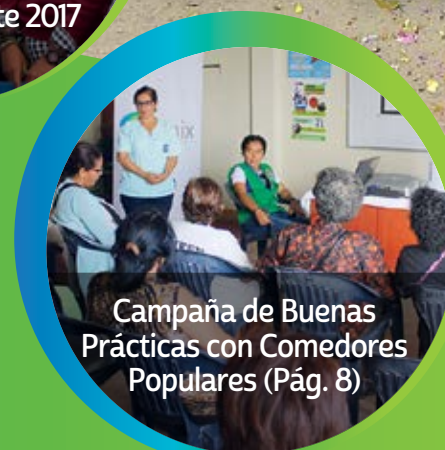
Campaña de Buenas Prácticas con Comedores Populares (Pág. 8)