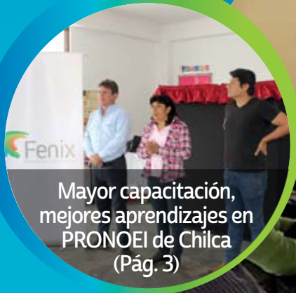
Mayor capacitación, mejores aprendizajes en PRONOEI de Chilca (Pág. 3)