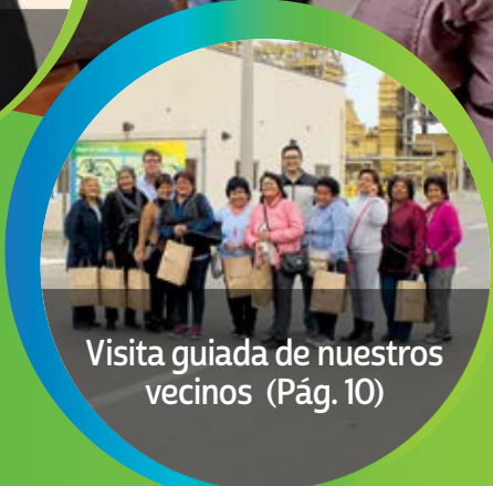
Visita guiada de nuestros vecinos (Pág. 10)