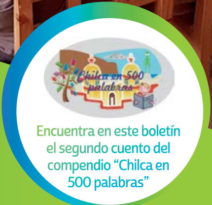
Encuentra en este boletín el segundo cuento del compendio "Chilca en 500 palabras"