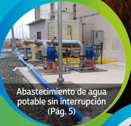
Abastecimiento de agua potable sin interrupción (Pág. 5)