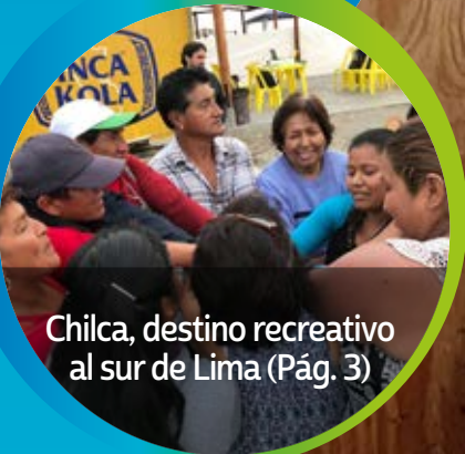
Chilca, destino recreativo al sur de Lima (Pág. 3)