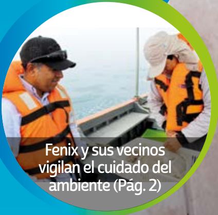
Fenix y sus vecinos vigilan el cuidado del ambiente (Pág. 2)

PROGRESO PARA CHILCA, ENERGÍA PARA EL PERÚ